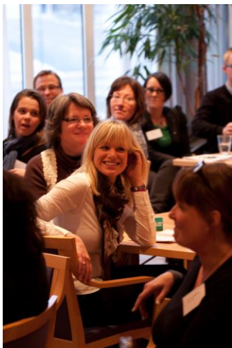
Deltagare på ALMI- seminariet 27 okt

Titel: Ta betalt! Författare: Maria Österåker