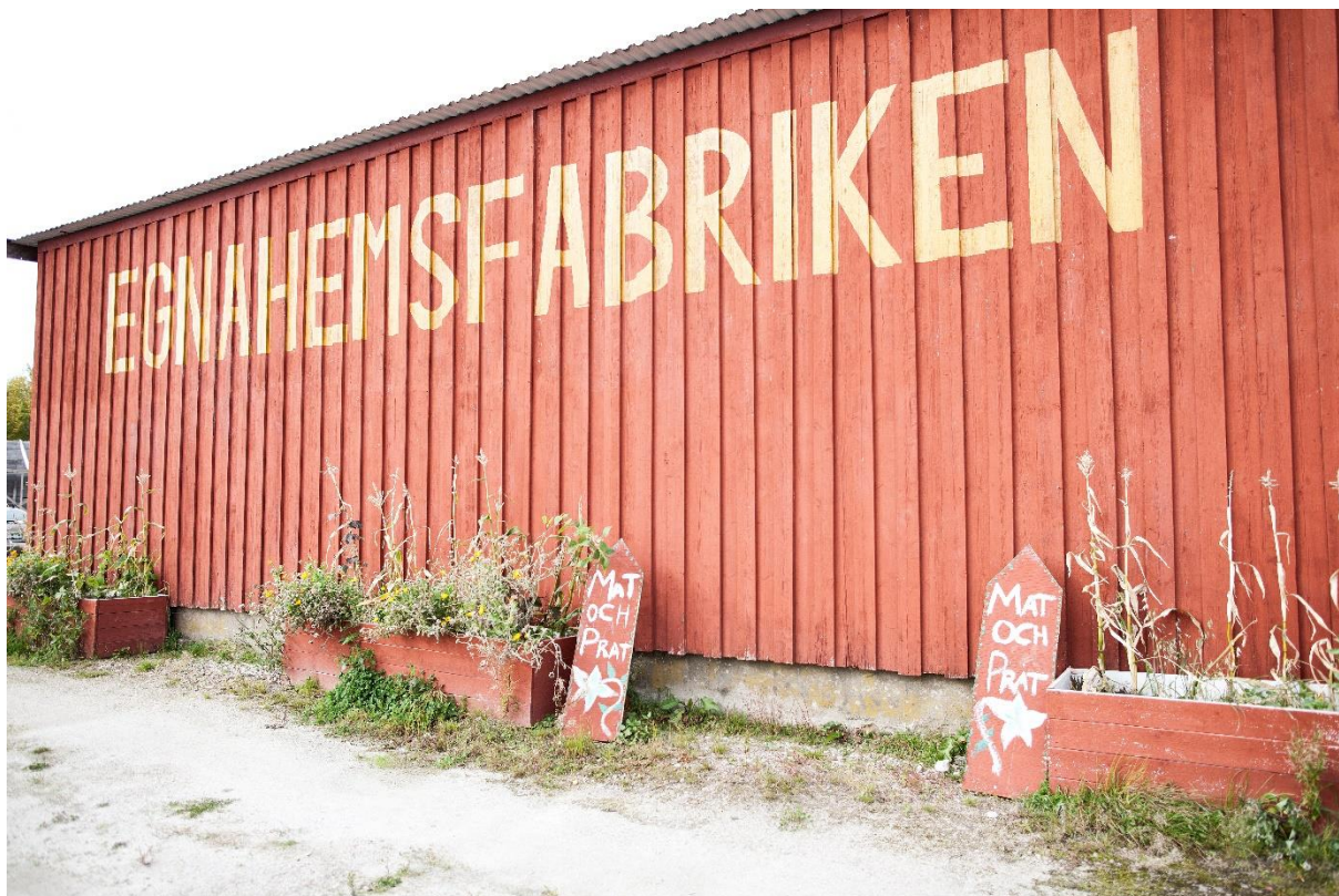
En annan landsbygd, Wallénhallen 28/9 – 9/10, Fotograf Sara Gust.