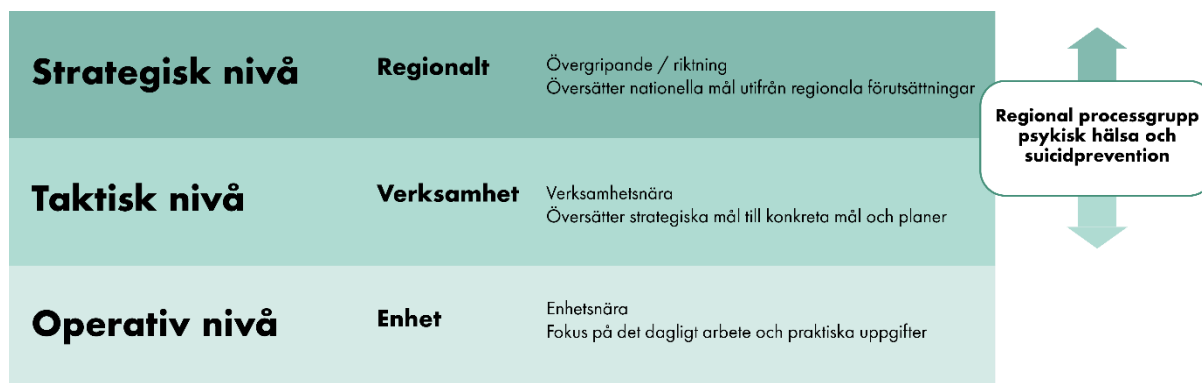
Bild 1. Översikt över strategisk, taktisk och operativ nivå – från regional effekt till arbetssätt i verksamhet och enhet.

I operativt arbete fokuseras det på det dagliga arbetet och genomförandet av konkreta uppgifter. Här handlar det om att utföra aktiviteter och följa de planer som tagits fram på den taktiska nivån, vilket innebär att man arbetar direkt med praktiska åtgärder för att uppnå kortsiktiga mål.