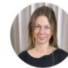
My Erdfelt Produktionsledare Yrkesresan Kommunförbundet Västernorrland