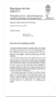
Nationell strategi för psykisk hälsa och suicidprevention 2025-2034